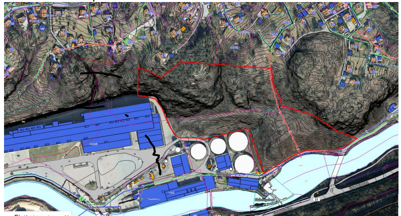
Ortofoto – innpillsområdet markert med rødt